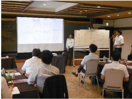
*合宿研修(36期 ホテルサン人吉)

●田原塾のスタイルは、基本的に対面講義です。感染症拡大時は、ZOOM活用によるリモート講義を取り入れております。