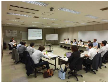
*第6会合 in熊本ソフトウェア(36期)