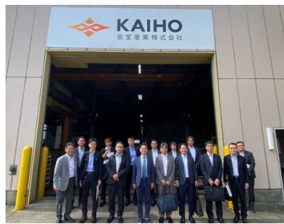
*国内視察 in 石川(36期)