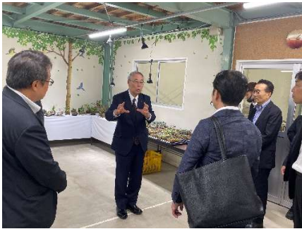
*国内視察 in 石川(36期)