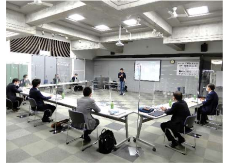
*パーティションを用いた講義風景(32期)