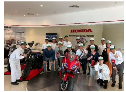
*海外視察 in タイ(36期)