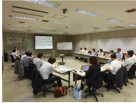
*第6会合 in熊本ソフトウェア(36期)