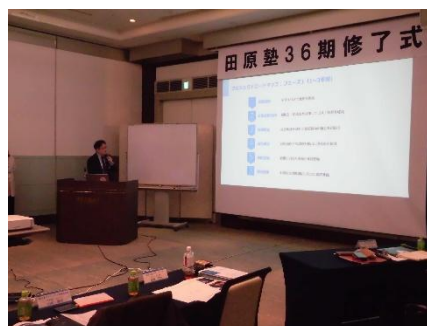
*グループ研究発表