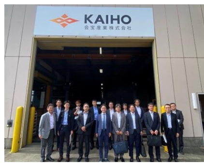
*国内視察 in 石川(36期)