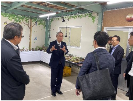
*国内視察 in 石川(36期)