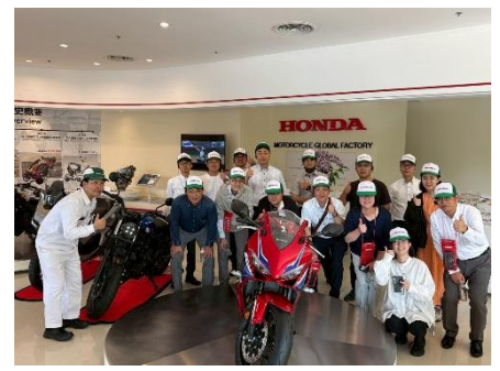
*海外視察 in タイ(36期)