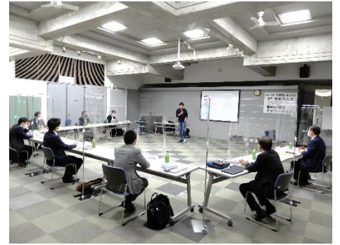
*パーティションを用いた講義風景(32期)