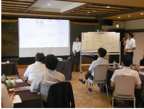
*合宿研修(36期 ホテルサン人吉)

●田原塾のスタイルは、基本的に対面講義です。感染症拡大時は、ZOOM活用によるリモート講義を取り入れております。