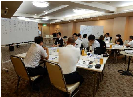
*合宿研修(34期 ホテルセキア)

●田原塾のスタイルは、基本的には感染対策を講じたうえで対面講義です。感染症拡大時は、ZOOM活用によるリモート講義を取り入れております。