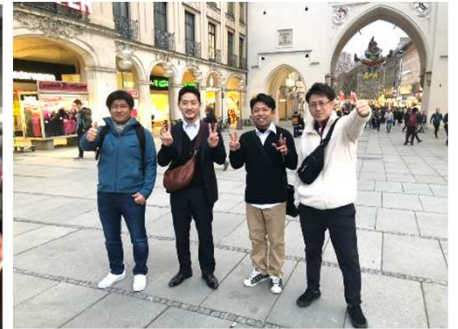
*海外視察 in ミュンヘン(30期)