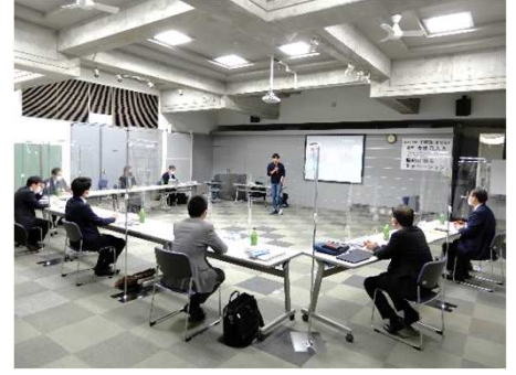
*パーティションを用いた講義風景(32期)