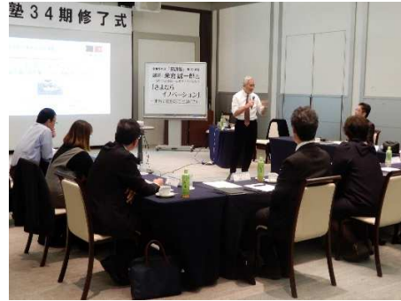
*第12会合 in熊本城ホール(34期)